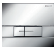
Chromé brillant/Inserts mats Réf. : 31 1722 60