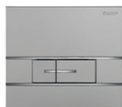
Aspect inox/Inserts brillants Réf. : 31 1712 60